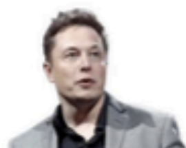
Elon Musk, PDG de SpaceX et de Tesla

Info+ : la fusée a transporté la Tesla Roadster d'Elon Musk avec à son volant le plus grand pilote de l'histoire: Starman le mannequin.